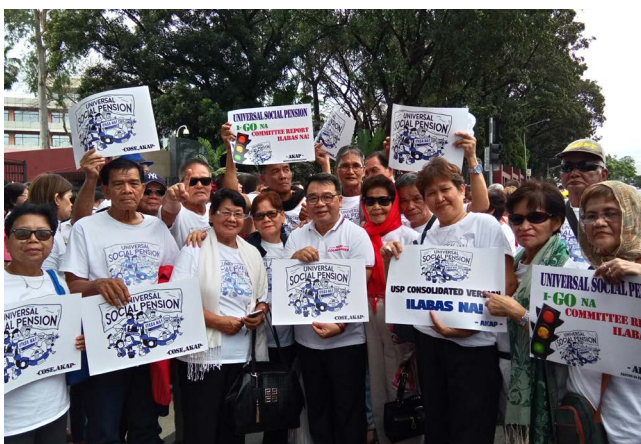
Coalition of Services for the Elderly

Coalition of Services for the Elderly, Filipinas (COSE)