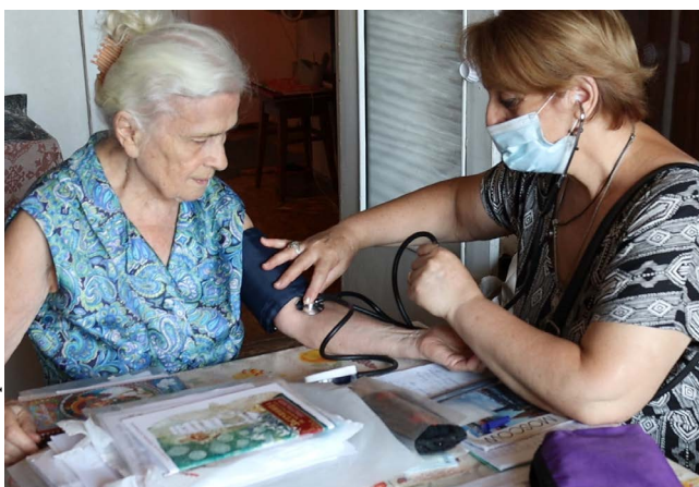
Благотворительная общественная организация «Миссия Армения»

«Участие в исследовательской и правозащитной программе HelpAge принесло нам огромную пользу. У нас была возможность не только получить новые фактические данные высокого качества, но и обменяться опытом и уточнить цели нашей правозащитной деятельности».