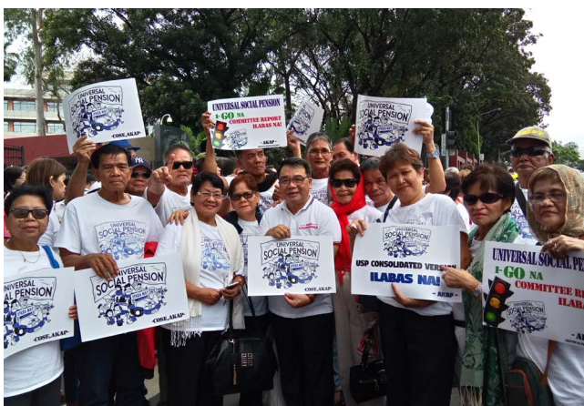
Коалиция услуг для пожилых людей

«Членство в глобальной сети HelpAge позволяет нам быть частью всемирного партнерства и вносить свой вклад в международное движение за перемены, чья цель — включение прав пожилых людей в глобальную повестку».