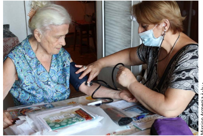
منظمة Mission Armenia

"تتيح لنا العضوية في شبكة HelpAge العالمية أن نكون جزءًا من شراكة عالمية وأن يكون لدينا مساهمات في الحركة الدولية للتغيير التي تهدف إلى وضع حقوق كبار السن على جدول الأعمال العالمي."