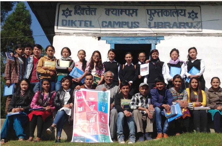
منظمة Ageing Nepal

تعد مجموعة العمل المختصة برسم المناهج المحلية القائمة على أساس العمل المجتمعي في helpAge منصة رائعة لنا للانضمام إليها. أعضاء المجموعة هم من الخبراء المتحمسين لتطوير موارد المجتمع الصحي للشيخوخة. لقد عززت المنصة معرفتنا وفهمنا للممارسات الجيدة لبناء نهج مجتمعي في مناطق مختلفة من شبكة HelpAge. كما ساعدتنا على تعزيز علاقتنا مع أعضاء الشبكة من مختلف البلدان. أعتقد أن هذا التضامن سيكون مفيدًا في تحفيز الناس على اتخاذ إجراءات بشأن الشيخوخة الصحية في جميع أنحاء العالم."