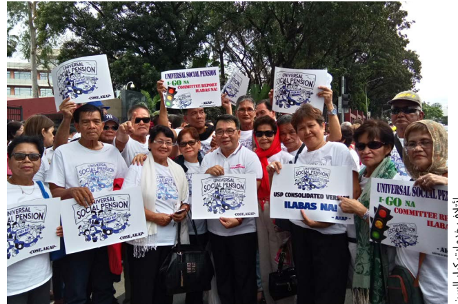
ائتلاف خدمات كبار السن

"ائتلاف خدمات كبار السن هو عضو قديم في الشبكة العالمية وقد استفاد من الخبرات وأفضل الممارسات لأعضاء الشبكة الآخرين التي نكررها الآن في الفلبين."