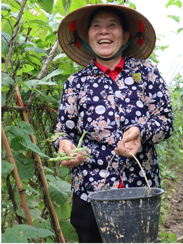
Le Minh Duc/HelpAge International

اب يرق انقيرف كعم لصاوتيسو انرابخ اى جري ، ةك بشلا لى لا ماضنالا يف بغرت تنك اذا