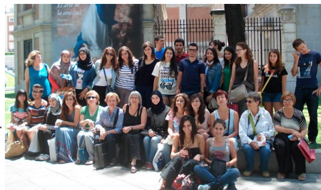
Universidad para Personas

En términos de recursos humanos, muchos de los participantes del proyecto dependen en gran medida de dos coordinadores muy eficientes en la Universidad para Personas Mayores, que tienen muchas otras responsabilidades. Será importante garantizar un buen equilibrio entre la eficiencia y seguir empoderando a todos los participantes con la distribución de responsabilidades.