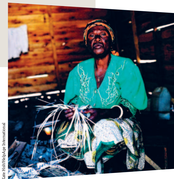
Kate Holt/HelpAge International

Dans une évaluation rapide, vous pourrez vous servir de données secondaires ou faire appel à des informateurs clés pour répondre à un grand nombre de ces questions.