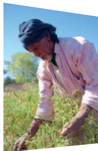
Jeff Williams/HelpAge International

Ce rapport a été financé par l'Office Humanitaire des Communautés Européennes (ECHO). ECHO finance les opérations de secours pour les victimes de catastrophes naturelles et de conflits à l'extérieur des frontières de l'Union européenne. Les fonds sont directement versés aux victimes, en toute impartialité, sans distinction de race, de groupe ethnique, de religion, de genre, d'âge, de nationalité ou de convictions politiques.