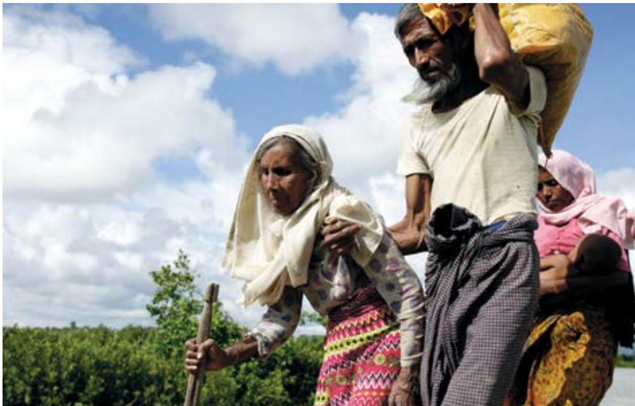
Пожилые люди Мьянмы бегут из своих домов в Кокс Базар в Бангладеш

Совокупный эффект таких тенденций, как изменение климата, давление на природные ресурсы, затяжные конфликты, противодействие правам человека и сокращение межстранового сотрудничества, окажет давление на международные рамки и приоритеты, оказав глубокое воздействие на международные усилия в области развития. Это может привести к росту неравенства и ограничению возможностей для решения глобальных проблем. Несоразмерно пострадают пожилые люди, особенно те, которые имеют более низкий уровень устойчивости или живут в самых бедных или наиболее уязвимых сообществах.