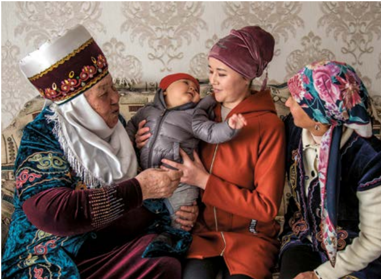
В селе Джети-Огуз, Кыргызстан, пожилые члены межпоколенческой группы делятся с молодежью секретами ухода за детьми