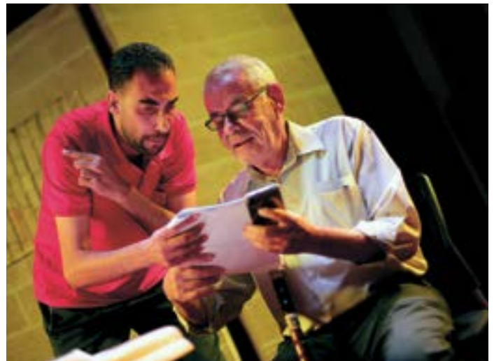
Пожилые люди в Газе участвуют в театральной постановке против эйджизма

Мы изучим, как старение населения пересекается с другими глобальными тенденциями (такими как изменение климата, нехватка ресурсов, урбанизация и технологии), и узнаем о потенциальном воздействии на права пожилых людей и о возможностях сотрудничества с политиками и лицами, принимающими решения, в целях продвижения позитивных изменений.