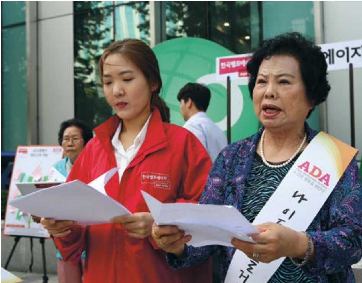
Участницы кампании «Возраст требует действий» в Корее присоединяются к движению по разоблачению эйджизма в Международный день пожилых людей, 2019 год