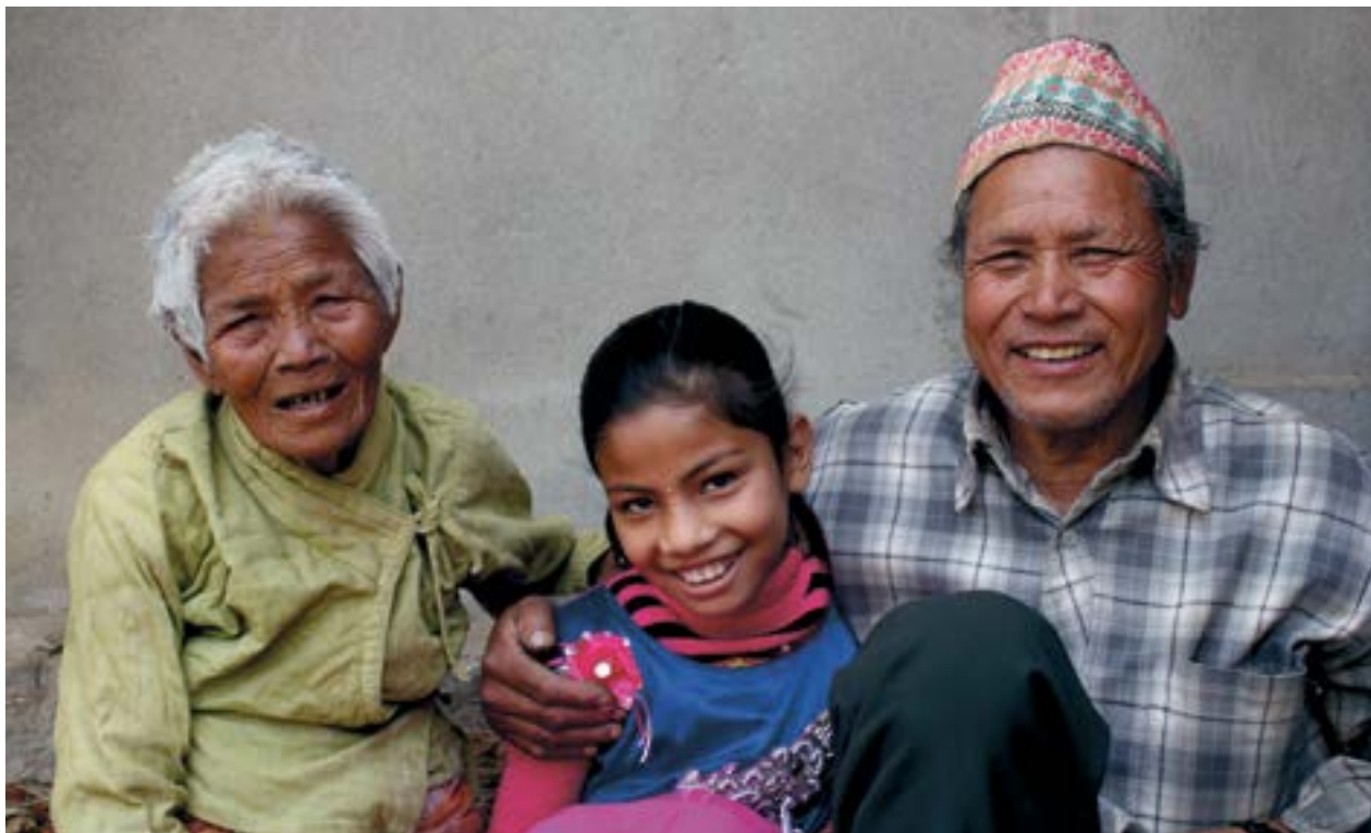
Judith Escribano/Age International

Кайлаш, член Непальской ассоциации пожилых людей, получил денежный перевод, чтобы поддержать себя и свою семью