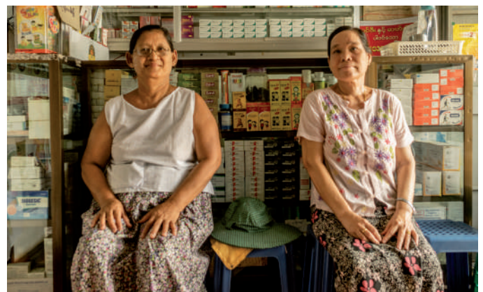
Ben Small/HelpAge International