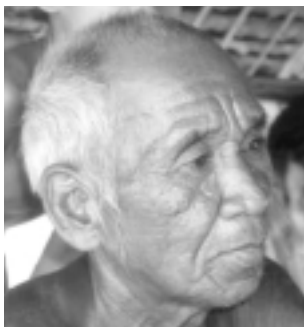
Ya Katey: 'No teníamos nada. Usábamos ropa que tejíamos con nuestras propias manos.'

Un proyecto de historia oral iniciado por HelpAge International ha capitalizado algunos de los recuerdos gráficos que guardan los camboyanos y camboyanas mayores sobre su pasado. Un nuevo video de 30 minutos, diseñado para mejorar el prestigio de las personas mayores e influenciar a ONG, funcionarios del gobierno, instituciones donantes y periodistas, muestra a expositores mayores reflexionando sobre cómo los remezones de los últimos 50 años influenciaron sus vidas diarias.