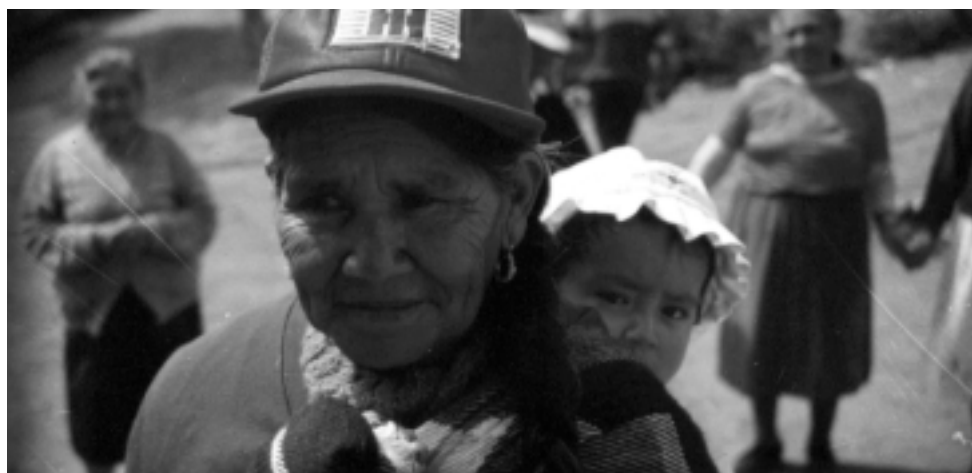
Avanzando... las opiniones de las personas mayores enriquecerán el Plan Internacional de Acción revisado.

http://www.madrid2002-envejecimiento.org