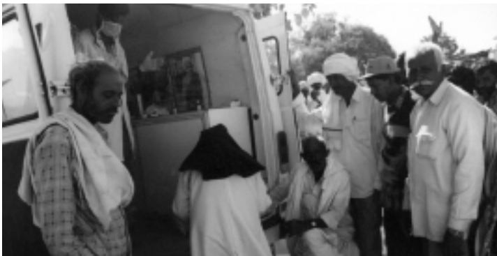
Ayuda en emergencia... una unidad móvil de salud de HelpAge India proporciona atención de salud luego del terremoto de Gujarat.

Dos meses después del terremoto que destruyó partes del Estado indio de Gujarat, la mayoría de las personas mayores de las aldeas más perjudicadas seguían viviendo al aire libre o en refugios temporales.