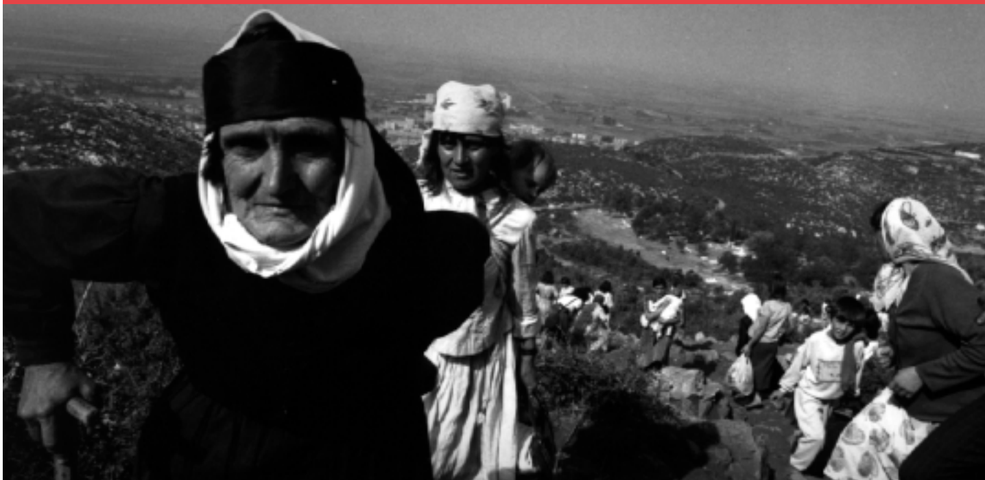
Mirando hacia adelante... una propuesta de la Comisión Europea podría mejorar las perspectivas para la tercera edad en Europa Oriental y Central.