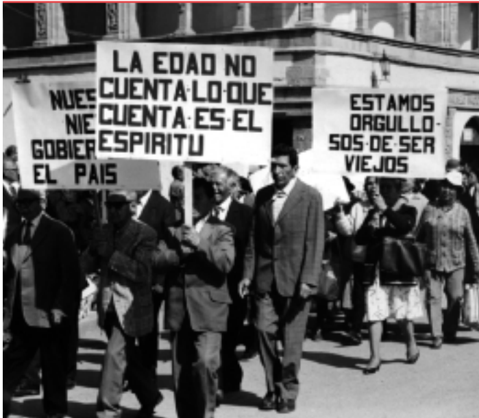
Buscando apoyo... manifestación de personas mayores en Bolivia.