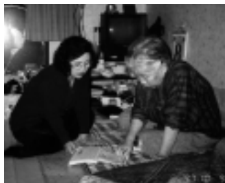
Una vida mejor para las personas mayores – leyendo con una voluntaria.

El Instituto de Ciencias para Mejorar la Calidad de Vida de los Mayores de Seúl, Corea, está emprendiendo estudios sobre la magnitud y la naturaleza del maltrato contra la tercera edad. Los estudios revelan que el maltrato contra dicho grupo etario constituye un grave problema en aumento y se relaciona con las tendencias de la tercera edad en Corea. El trabajo explora las definiciones de maltrato y los factores