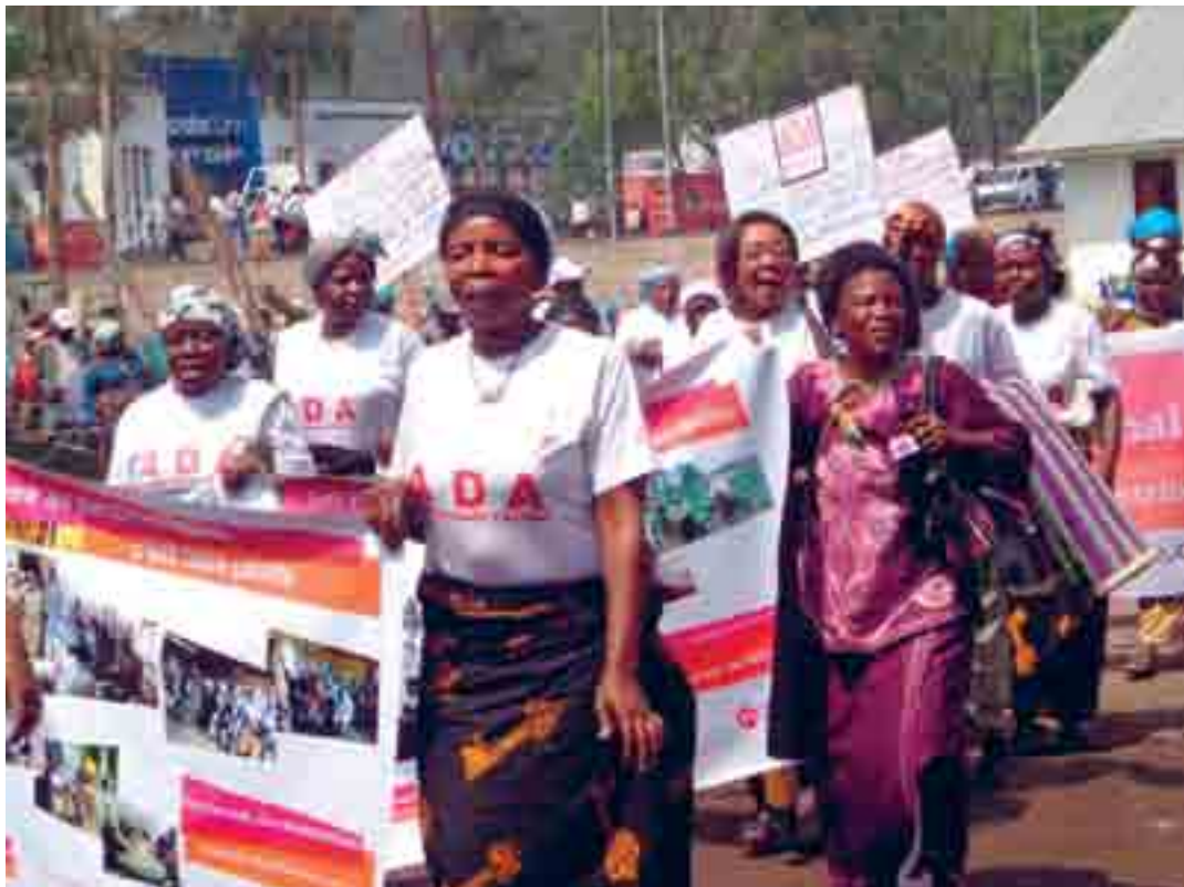
HelpAge International (Democratic Republic of Congo)

Заметка: Трактовка причин проблемы зависит от вашей собственной точки зрения. Помните, что вы сами можете выбрать, как позиционировать свою кампанию, так как вы сами хорошо знаете контекст и проблему.