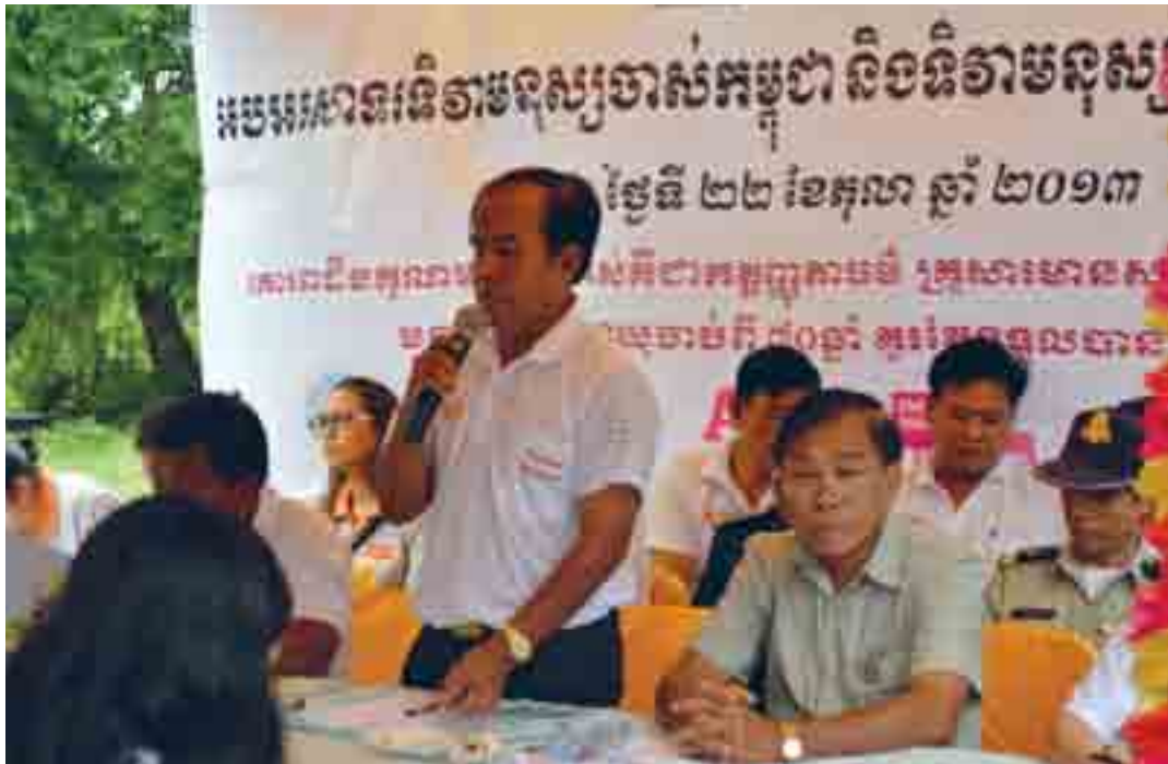
HelpAge International (Cambodia)