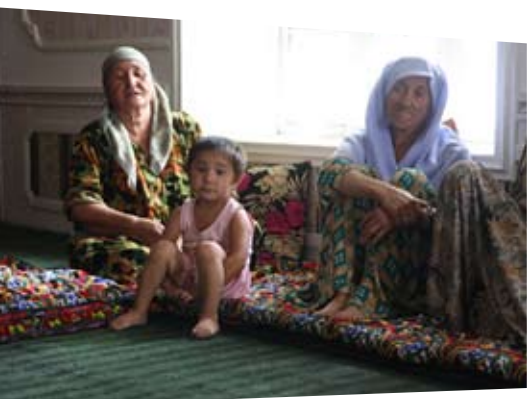
Халпайдж Интернэшнл/Алекс Шлаффер

Прежде всего, план предполагает налаживание партнерских отношений между государственными учреждениями, гражданским обществом, частным сектором и пожилыми людьми для выполнения следующих практических задач: