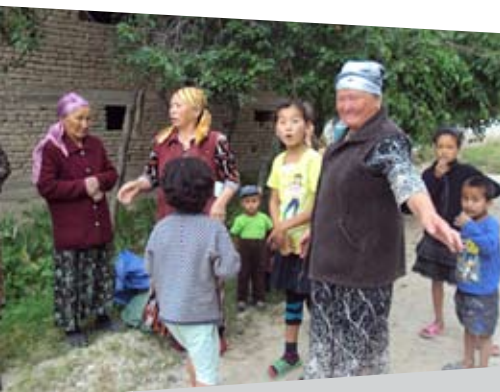
Хэлпэйдж Интернэшнл/Анонс Шлаффер

В настоящее время государства и социальные структуры не в состоянии признать жизненно важную роль пожилых людей в воспитании детей. Сотни тысяч детей в мире оказались бы в детских домах, приютах или на улице не будь их дедушек и бабушек. Они могли бы оказаться беспомощными перед лицом многих испытаний.