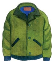
เสื้อกันหนาว

ถ้าคุณอยู่ในพื้นที่เสี่ยงต่อภัยพิบัติ ควรเตรียมถุงยังชีพที่บรรจุสิ่งของจำเป็นให้พร้อม เพื่อเตรียมรับมือกับสถานการณ์ฉุกเฉิน หรือหากต้องอพยพฉุกเฉิน