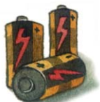
ถ่านไฟฉาย