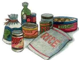
อาหารแห้ง เช่น ข้าวสาร อาหารกระป๋อง