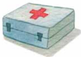
ยาประจำตัว ยาสามัญประจำบ้าน ชุดปฐมพยาบาล

เอกสารสำคัญต่างๆ เช่น สูติบัตร บัตรประชาชน ทะเบียนบ้าน สมุดบัญชีธนาคาร พาสปอร์ต