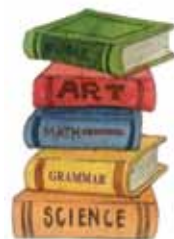
หนังสือเรียนของเด็กๆ