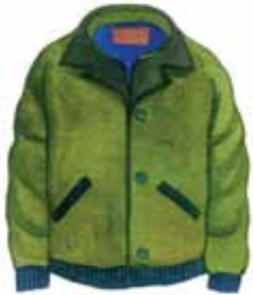
เสื้อกันหนาว

ถ้าคุณอยู่ในพื้นที่เสี่ยงต่อภัยพิบัติ ควรเตรียมถุงยังชีพที่บรรจุสิ่งของจำเป็นให้พร้อม เพื่อเตรียมรับมือกับสถานการณ์ฉุกเฉิน หรือหากต้องอพยพฉุกเฉิน