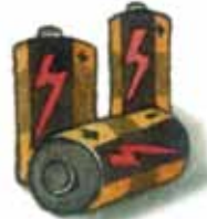
ถ่านไฟฉาย