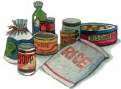
อาหารแห้ง เช่น ข้าวสาร อาหารกระป๋อง