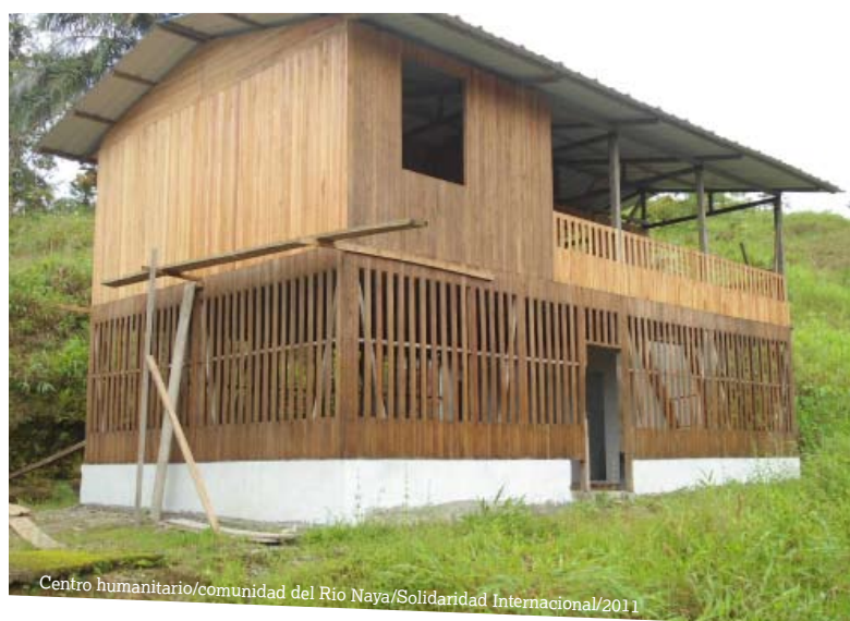
Centro humanitario/comunidad del Río Naya/Solidaridad Internacional/2011

Adicionalmente, HelpAge International complementó la dotación de los paquetes entregados por Solidaridad Internacional a las personas mayores que formaban parte de sus beneficiarios en temas de infraestructuras, con la provisión de sillas de descanso, linternas, bacinillas, entre otros elementos adecuados para personas mayores y personas con discapacidad.