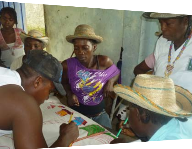
Personas mayores del Rio Naya - Buenaventura, durante una jornada de elaboración de planes de contingencia con la comunidad.