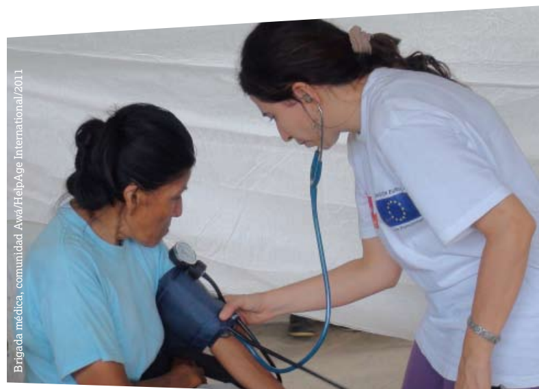
Brigada médica, comunidad Awá/2011

En particular, a través de la atención específica de las brigadas de salud en áreas de difícil acceso, las personas mayores estarán más concientes de sus problemas de salud y de cómo manejarlos ante la ausencia de servicios estatales.