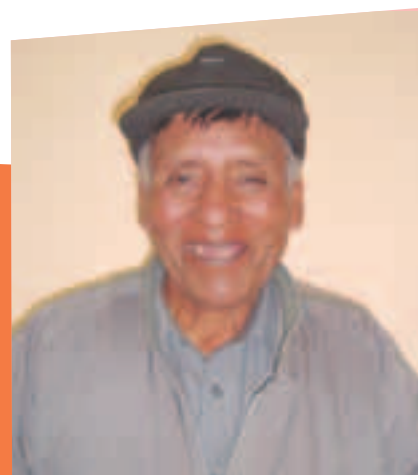
Lisett Larico/HelpAge International

He ido a esa defensoría, con una amargura que no podía aguantar, sinceramente; estaba llorando, mi corazón estaba... Pensaba que no me iban a ayudar las señoritas (del COSL), hasta ese momento no había recibido ninguna ayuda... (Me han dado) orientaciones, me han recibido bien. Me lamento porque así había sido la suerte... tener hijos... Ahora vamos a firmar un documento. En eso estoy ahora. Sí, con mi hijo mayor voy a arreglar con calma, pero no quiero exagerar... Mi hijo, por más que sea malcriado, me ayuda...”