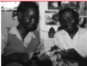
Enfocados... indicadores de salud serán definidos en el Caribe.