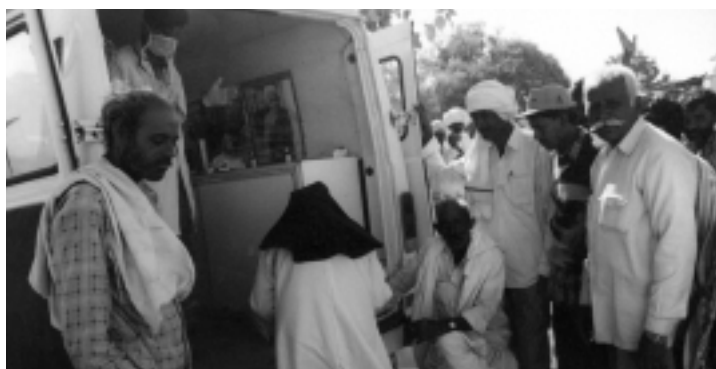
Ayuda en emergencia... una unidad móvil de salud de HelpAge India proporciona atención de salud luego del terremoto de Gujarat.

Dos meses después del terremoto que destruyó partes del Estado indio de Gujarat, la mayoría de las personas mayores de las aldeas más perjudicadas seguían viviendo al aire libre o en refugios temporales.