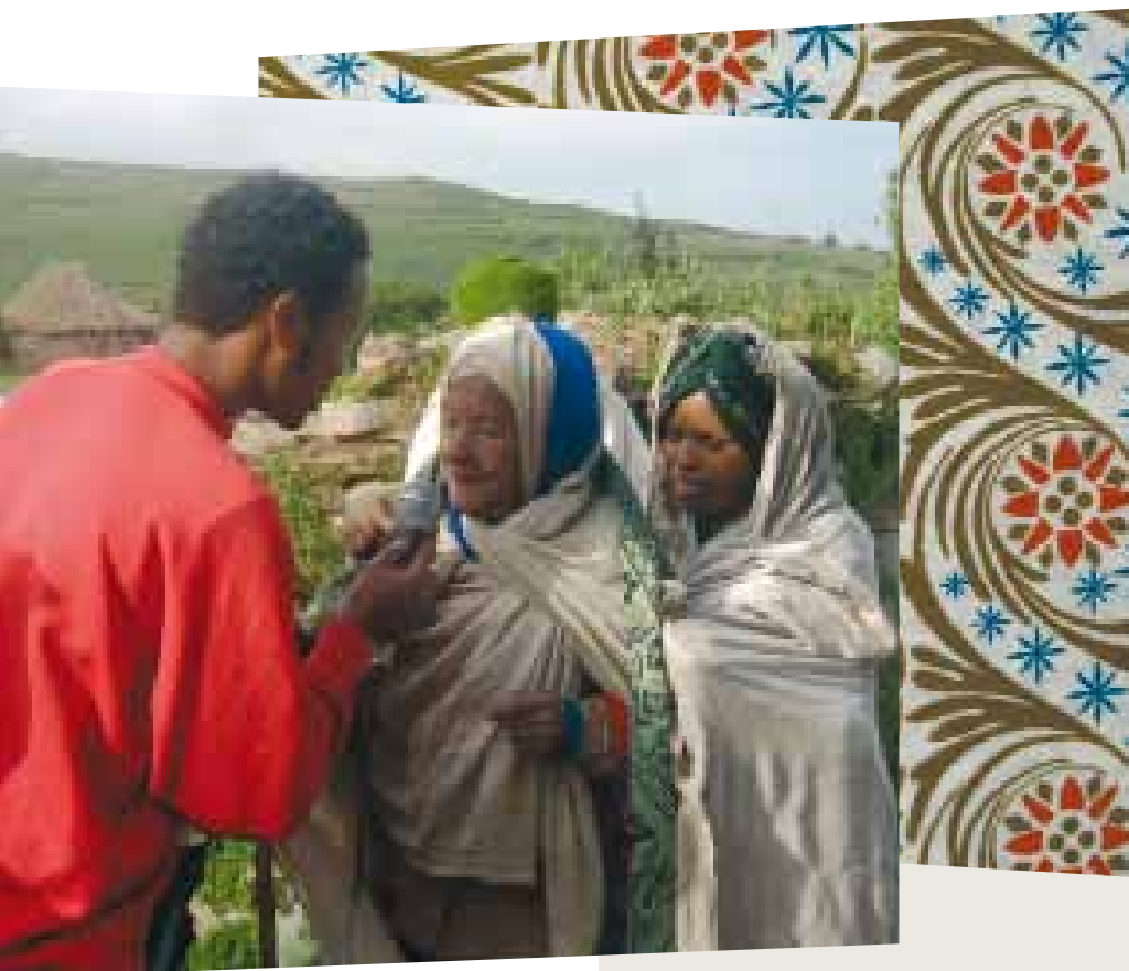
Una marcha de protesta de personas mayores organizada por Noble Cause Elder Care and Support atrajo cobertura de la radio local en la región de Amhara, Etiopía.