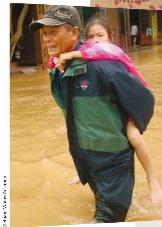
Vietnam Women's Union

Utilice citas e historias. Una cita bien elaborada puede lograr el mismo efecto que las cifras. El coordinador de alivio de la ONU Jan Egeland dio a reporteros algo sobre lo cual escribir en marzo de 2005 cuando dijo que la cantidad de muertos en la República Democrática del Congo en los últimos seis años equivalía a "un tsunami cada seis meses". Las citas y las historias de personas mayores