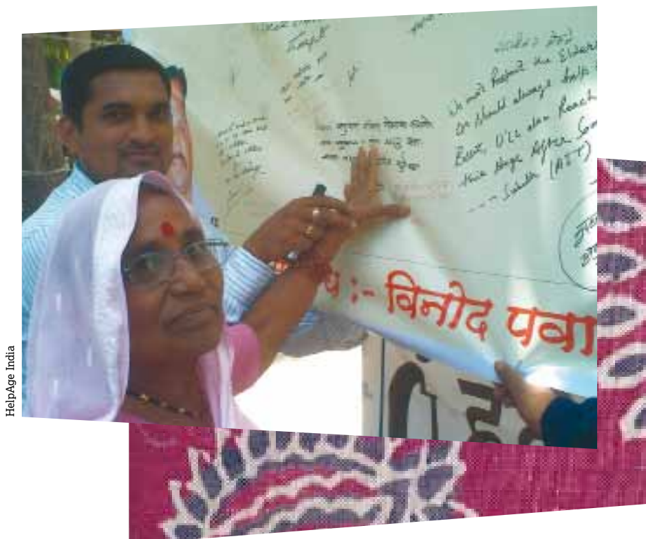
Una mujer mayor firma apoyando “Di No al Abuso de Personas Mayores” en Vishrantwadi, Pune.