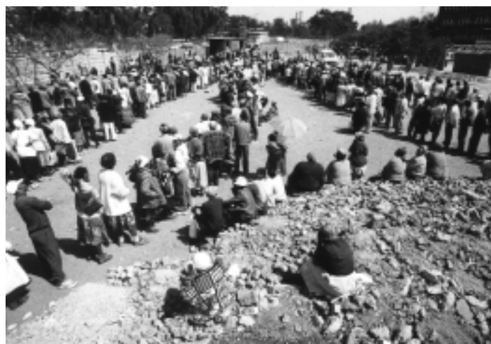
Avanzando lentamente... esta cola para cobrar pensiones en Bloemfontein, Sudáfrica, refleja avances en el reconocimiento de los derechos de la tercera edad.

La tercera edad es mencionada con menos frecuencia que las personas con discapacidades (que ocupan un párrafo entero), los refugiados y las mujeres. Sin embargo, sí hay referencias tales como 'énfasis en el aprendizaje a todas las edades,' 'equidad entre las generaciones' y políticas para empoderar a las personas para que gocen de buena salud y sean productivas 'a lo largo de sus vidas,' que indican que existe conciencia sobre la necesidad de incluir específicamente a las personas mayores. La calidad de estas referencias es mejor que en otros documentos, que se limitan a reconocer a la tercera edad como parte de una larga lista de grupos vulnerables y desaventajados.