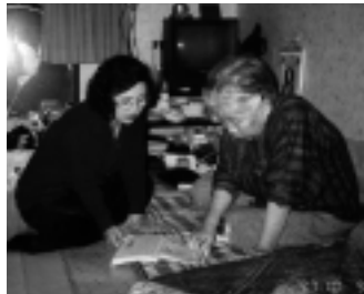
Una vida mejor para las personas mayores – leyendo con una voluntaria.

El Instituto de Ciencias para Mejorar la Calidad de Vida de los Mayores de Seúl, Corea, está emprendiendo estudios sobre la magnitud y la naturaleza del maltrato contra la tercera edad. Los estudios revelan que el maltrato contra dicho grupo etario constituye un grave problema en aumento y se relaciona con las tendencias de la tercera edad en Corea. El trabajo explora las definiciones de maltrato y los factores