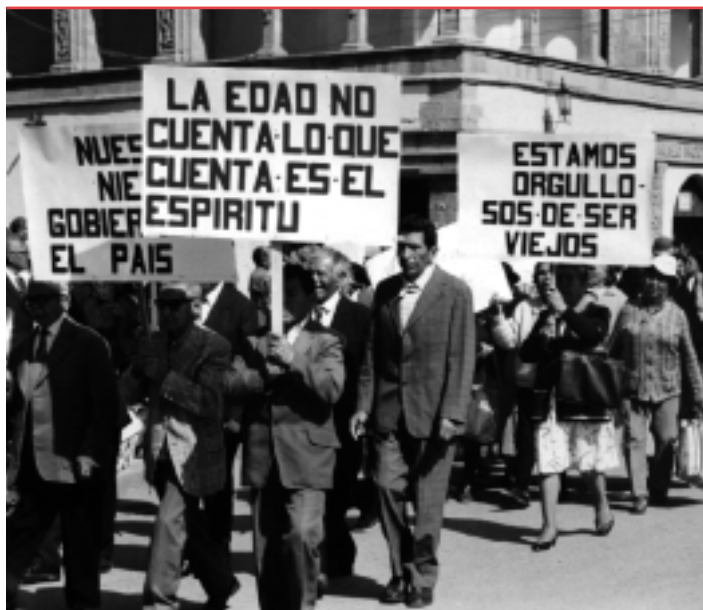
Buscando apoyo... manifestación de personas mayores en Bolivia.