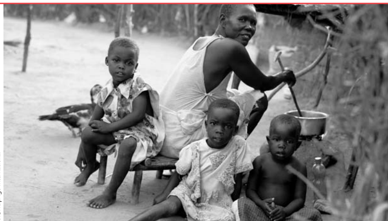
Kate Holt/HelpAge International

HelpAge International Africa Centro de Desarrollo Regional, PO Box 14888, Westlands, 00800 Nairobi, Kenia Email: helpage@helpage.co.ke