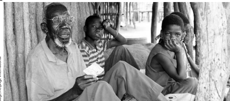
Hogares encabezados por personas mayores son mucho más pobres que el promedio, demuestra un estudio

'Saludamos los resultados del estudio con respecto al nivel de pobreza en la tercera edad a nivel de hogares,' dice Mark Gorman,