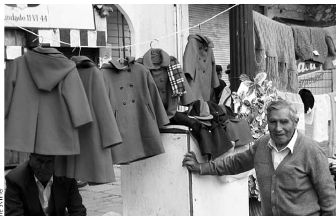
Este boliviano mayor se mantiene fabricando ropa infantil.